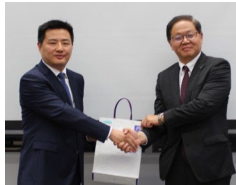
記念品交換の様子