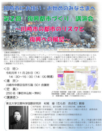
開催案内ポスター

講演会には約150名の参加があり、市民の防災に関する意識の高さが伺えました。台風19号で浸水被害を受けた川崎の市民に対して、災害リスクマネジメントに関する理解を深めてもらうことが出来ました。