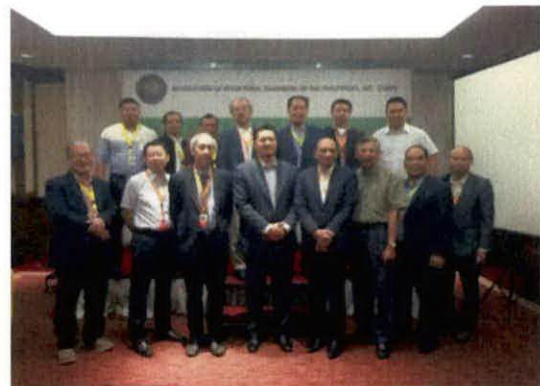
ポーディングメンバー集合写真