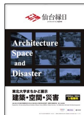
「建築・空間・災害」展のポスター